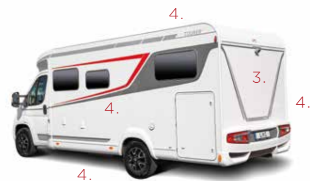
(abgebildet ist hier der Tourer T 660 G)